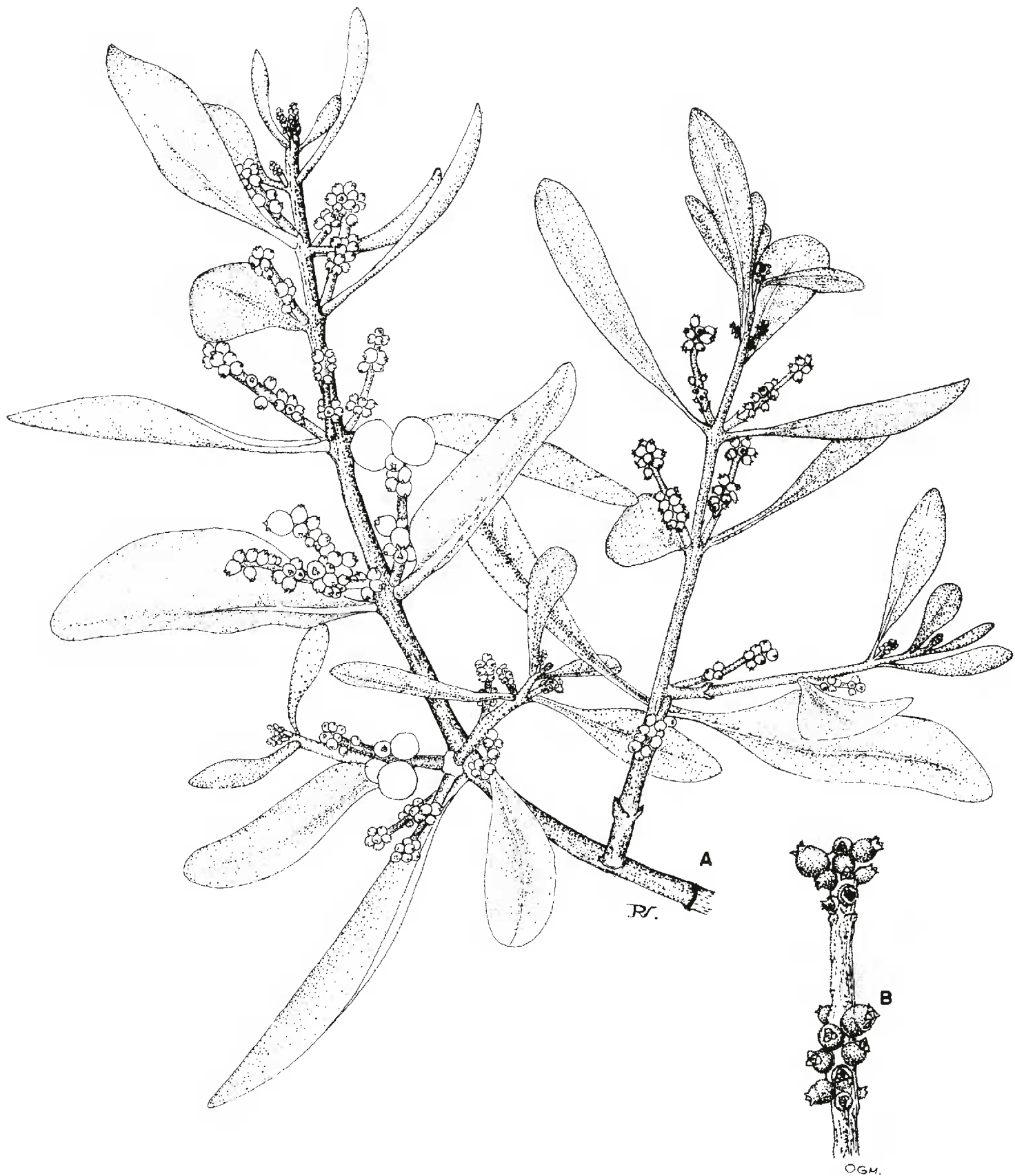
Fig. 2. Dendrophthora costaricensis Urban (M. Cházaro y H. Oliva 5253, IBUG). A. Ramilla con frutos jóvenes y maduros; B. Espiga femenina, con frutos muy jóvenes.